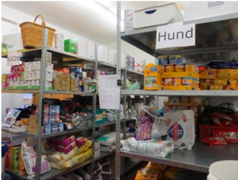
Ein scheinbar gut gefülltes Futterlager. Trotzdem reichen die Bestände der Berliner Tiertafel für die Versorgung der vielen angemeldeten Vierbeiner kaum aus.

Ganz schön stark: Die Berliner Tiertafel